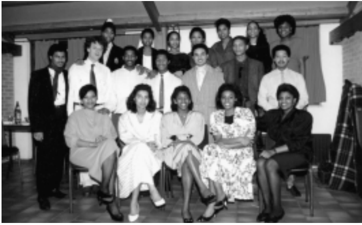
Het Kaapverdianse jongerenkoor uit Rotterdam. De Kaapverdianse parochie in Rotterdam is de grootste parochie van de stad.