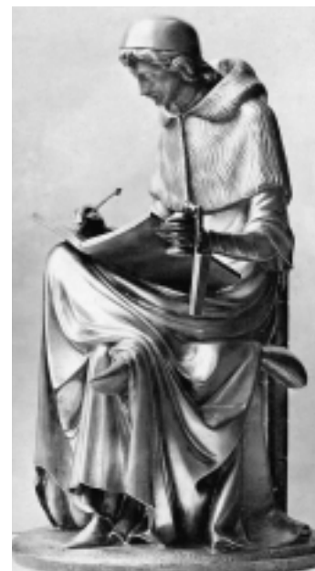
Aan de hand van deze foto werd de restauratie van het fonteinbeeld uitgevoerd.

Om dit mogelijk te maken werd eerst het nodige speurwerk naar een afbeelding met de originele schrijffattributen verricht. Deze afbeelding is uiteindelijk gevonden in de foto-documentatiecollectie van de familie Brom, ondergebracht in het Katholiek Documentatie Centrum te Nij-