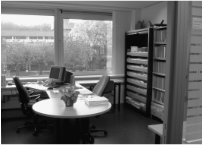
Een van de nieuwe kamers van het KDC na de recente verbouwing

samenwerking met het Gemeentearchief Nijmegen tot kostenbesparing zou leiden, maar de kosten bleken zelfs aanzienlijk hoger te liggen dan bij een beheer door het KDC.