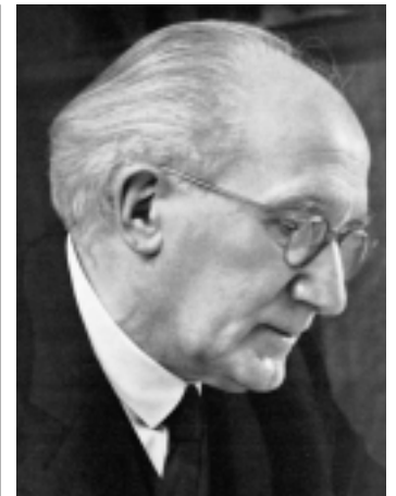
Romano Guardini.

deze in een prachtig gebaar aan een goede vriend, na een lang avondgesprek.