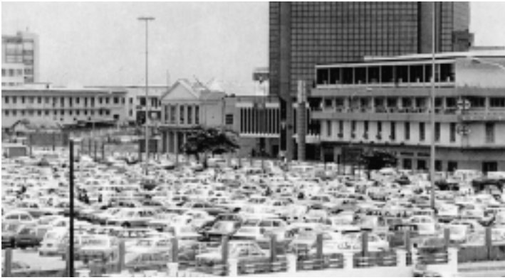
Kantoorgebouwen en drukte op Lagos Island.

hun zwarte collega's lui en het spijt hun dat de Apartheid is afgeschaft want toen wisten zwarten tenminste hun plaats. Zonder deze negatieve beelden te ontkennen, beklemtoont Mbigi het gezamenlijke belang van samenwerking en de positieve elementen van de 'ander'. In de Zuid-Afrikaanse samenleving kan de 'ander' een Afrikaanse, Europese of Indiase achtergrond hebben. Iedere achtergrond heeft pluspunten: Europese efficiency , Aziatische werkmoraal en Afrikaanse gemeenschapszin.