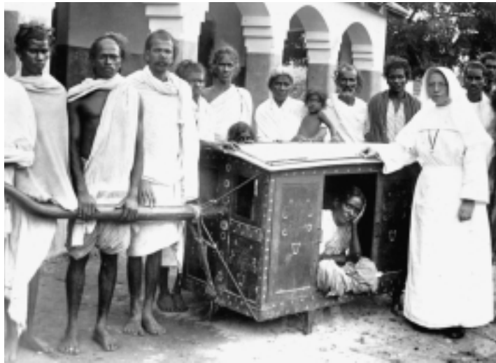
Nederlandse Zusters van Jezus, Maria en Jozef (JMJ) waren sinds 1904 werkzaam in Zuid-India. Een patiënte wordt met een draagstoel het St. Theresia Hospital in Kurnool binnengebracht.

De KMM werd in 1976 opgericht door het Katholiek Documentatie Centrum (KDC) in samenwerking met het Centraal Missie Commissariaat (CMC) en Missio/Pauselijke Missiewerken (MISSIO/PMW). Doelstelling was het verzamelen van herinneringen van Nederlandse missionarissen en het vastleggen van deze herinneringen op geluidsdragers om, als een aanvulling op schriftelijke bronnen, een geluidsarchief met 'mondelijke bronnen' op te bouwen ten behoeve van het wetenschappelijk onderzoek op het terrein van de missiegeschiedenis. Daarbij werd uitgegaan van de